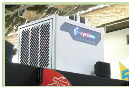
空気清浄機と分煙ボード

弊社のウェブサイト、当CSRはこうした方々でも文字やデザインが判読できるように配慮がされたものとして「NPO法人カラーユニバーサルデザイン機構」の認定をいただいています。