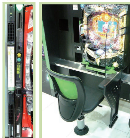
喫煙ブース(新琴似店)