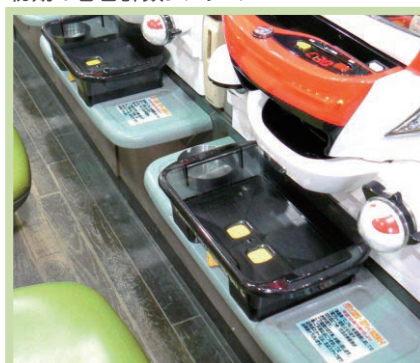
現在の各台計数システム