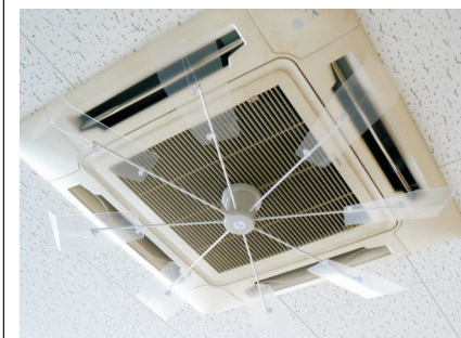
稼働中のファン(ファイターズ通り店)